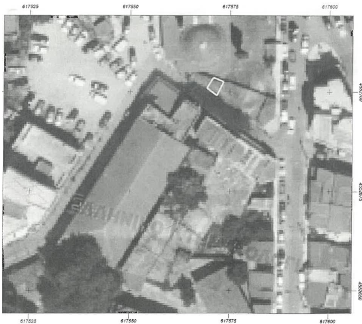
Φωτ. 1 Θέση του κτίσματος στον οικιστικό ιστό

Το κτίσμα βρίσκεται στην πρώτη σειρά της εξωτερικής παρειάς της οριοθετημένης περιοχής του ιστορικού τόπου της Κομοτηνής (απόφαση ΥΠΠΟ/ΔΙΛΑΠ/Γ/2880/51729/01-11-1999(ΦΕΚ 2059/Β/24-11-1999) στην οδό Γραβιάς.